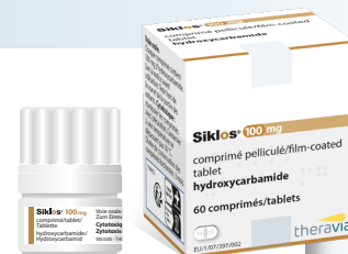
Boîte couleur OR