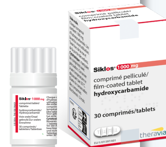
Boîte couleur ROUGE

Merci de bien vouloir présenter cette fiche à votre pharmacien avec l'ordonnance.