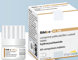
Boîte couleur OR