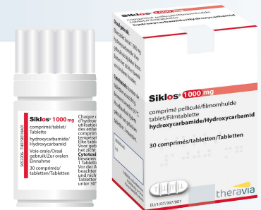
Boîte couleur ROUGE

Merci de bien vouloir présenter cette fiche à votre pharmacien avec l'ordonnance.