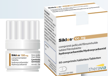
Boîte couleur OR