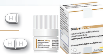
Boîte couleur OR

.... comprimé(s) entier(s) de 100 mg = ..... mg