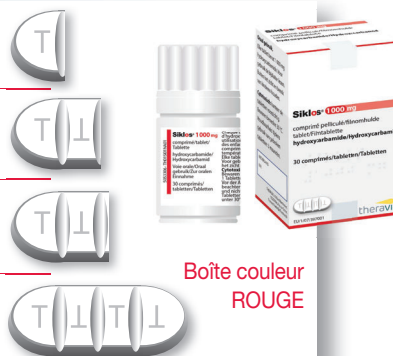
Boîte couleur ROUGE

.... comprimé(s) entier(s) de 1 000 mg = ..... mg