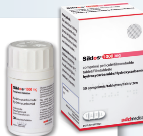
Boîte couleur ROUGE

Merci de bien vouloir présenter cette fiche à votre pharmacien avec l'ordonnance.