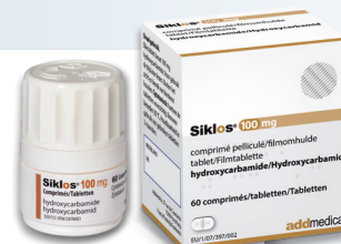
Boîte couleur OR