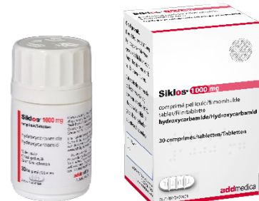
ROOD gekleurde doos