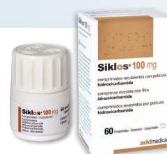
Boîte couleur OR