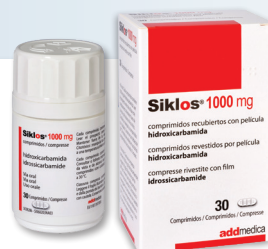
Boîte couleur ROUGE

Merci de bien vouloir présenter cette fiche à votre pharmacien avec l'ordonnance.